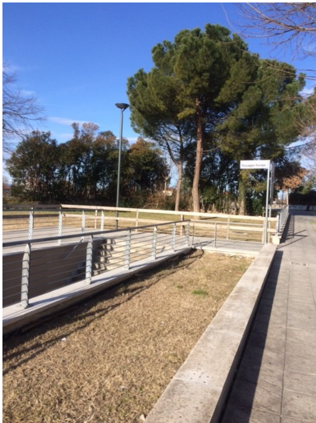
Uscita sottopasso Viale Marconi