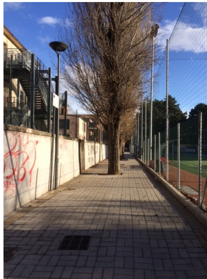
Vialetto tra "Piccicale" e ITIS